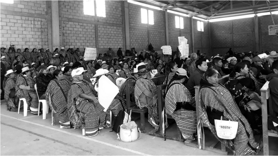
Asamblea General del núcleo agrario de Santo Domingo del Estado, Putla, Oaxaca, 2019.

se deben analizar los hechos en su contexto para concluir que se trata de una simple inconformidad contra una determinación comunitaria, en cuyo caso la autoridad competente para conocer de ello es la Sala de Justicia Indígena, mediante el Juicio de Derecho Indígena. Un caso es la comunidad de Guadalupe Nuevo Tenochtitlán que pertenece al municipio de Putla Villa de Guerrero, Oaxaca, donde el Juez de Control aceptó declinar competencia a la Sala de Justicia Indígena.