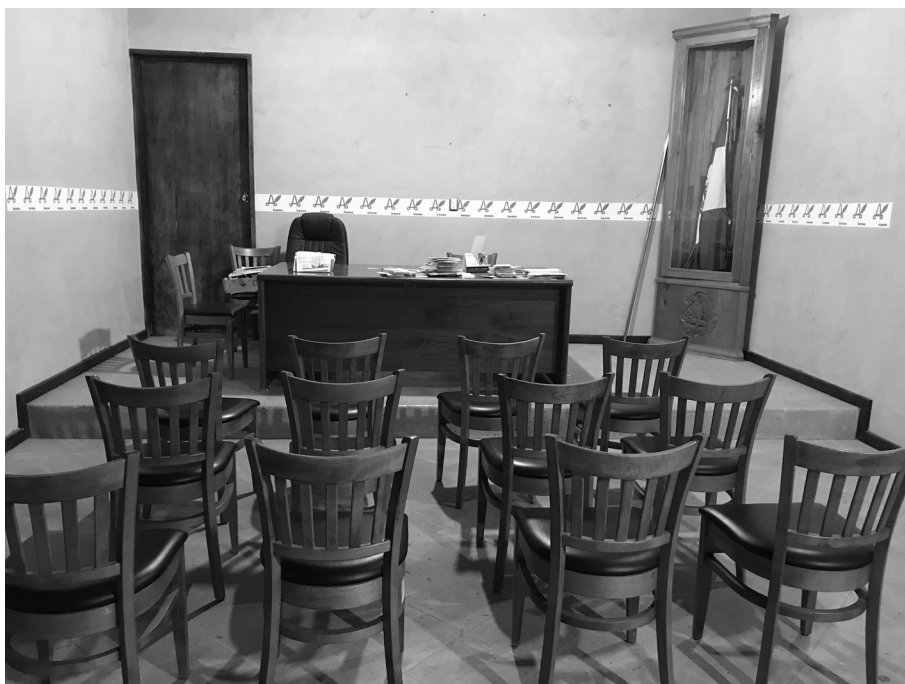
Sala del Cabildo de Santo Domingo Yanhuitlán, Oaxaca y lugar donde se realizan los procesos de impartición de justicia, 2018.

Los Síndicos y Alcaldes no son auxiliares del Ministerio Público y del Juez, más bien, son autoridades que ejercen competencia en sus respectivas comunidades para la resolución de problemas o conflictos que les son pre-