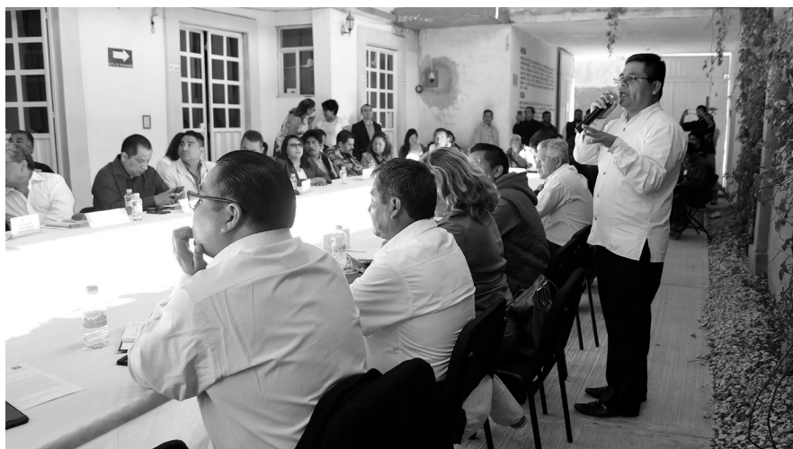
Diálogo entre autoridades indígenas que imparten justicia y la Fiscalía. Tlaxiaco, Oaxaca, 2018.

El 17 de septiembre de 2017, la asamblea general de comuneros acordó reintegrar a la comunidad un solar urbano comunal para recuperar parcialmente los gastos económicos que durante 27 años han erogado a causa de diversas