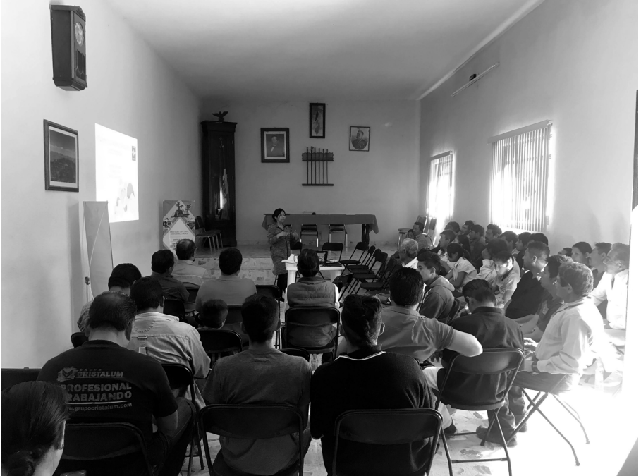
Taller: "Fortalecimiento de la justicia indígena en la región Runixa Ngigua-Ngiba " con autoridades de la región. Santiago Tepetlapa, Coixtlahuaca, Oaxaca, 2019

Las autoridades deben evitar situaciones que dificulten el cumplimiento de ciertos aspectos del convenio o acuerdo. En una comunidad donde los involucrados llegaron a un acuerdo, una de las cláusulas consistía en que se desistirían de las denuncias que presentaron en contra de la otra parte, sin embargo, no se precisó el tiempo que tenía la persona para hacerlo y tampoco se dijo si debía acreditarlo con algún documento expedido por la fiscalía o alguna otra evidencia que respaldara el cumplimiento de dicho acuerdo.