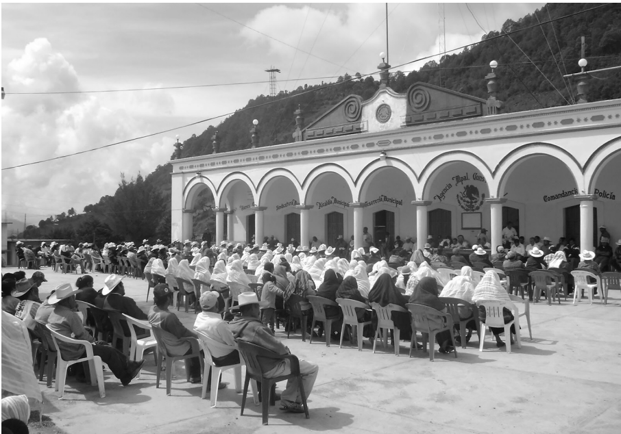
Hombres y mujeres en la asamblea comunitaria. Santa María Yucunicoco, Juxtlahuaca, Oaxaca, 2015*.

me a nuestro sistema de justicia o sistema normativo indígena, podrá acudir ante la autoridad de la cabecera municipal o en su defecto ante la Sala de Justicia Indígena del Tribunal Superior de Justicia de Oaxaca (TSJO), que es la instancia especializada en materia indígena en Oaxaca, para que conozca de la inconformidad que existe ante las resoluciones emitidas por las autoridades de los pueblos y comunidades indígenas en ejercicio de su función jurisdiccional al aplicar sus sistemas normativos, ello tal como lo dispone el artículo 23, fracción V, inciso a) de la Ley Orgánica del Poder Judicial del Estado de Oaxaca.