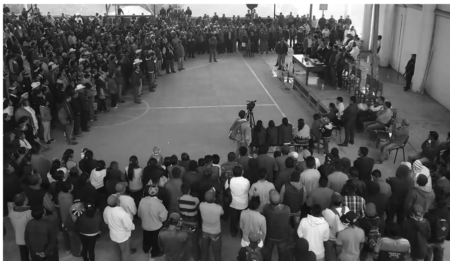
Asamblea General en San Miguel Suchixtepec, Miahuatlán, Oaxaca, 2016.

Los acuerdos adoptados ante la autoridad municipal se tienen que cumplir invariablemente, si alguien no lo hace, entonces, incurre en un acto que podría calificarse como desobediencia o desacato a un mandato de la autoridad o de la asamblea, según sea el caso. Por tal motivo, las autoridades deben buscar los mecanismos internos para hacer cumplir sus determinaciones y los acuerdos que se firmen ante ellos, esto incluye el auxilio de la fuerza pública en casos donde resulte necesario, pero en ninguna circunstancia se debe dejar de cumplir con algo que se ordenó.