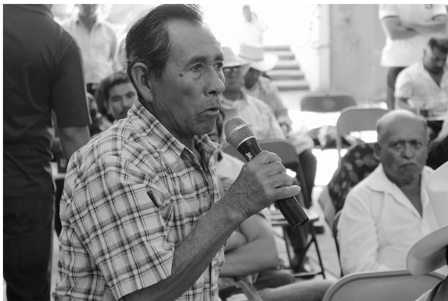
Autoridad explica en qué consiste el sistema de justicia comunitario, en el Foro Regional sobre Jurisdicción Indígena. Huajuapán de León, Oaxaca, 2013.

dades a respetarla. De encontrarse que durante la tramitación de un asunto se violaron derechos humanos o que la sanción impuesta no es proporcional al hecho, puede ordenar que se emita una nueva resolución.