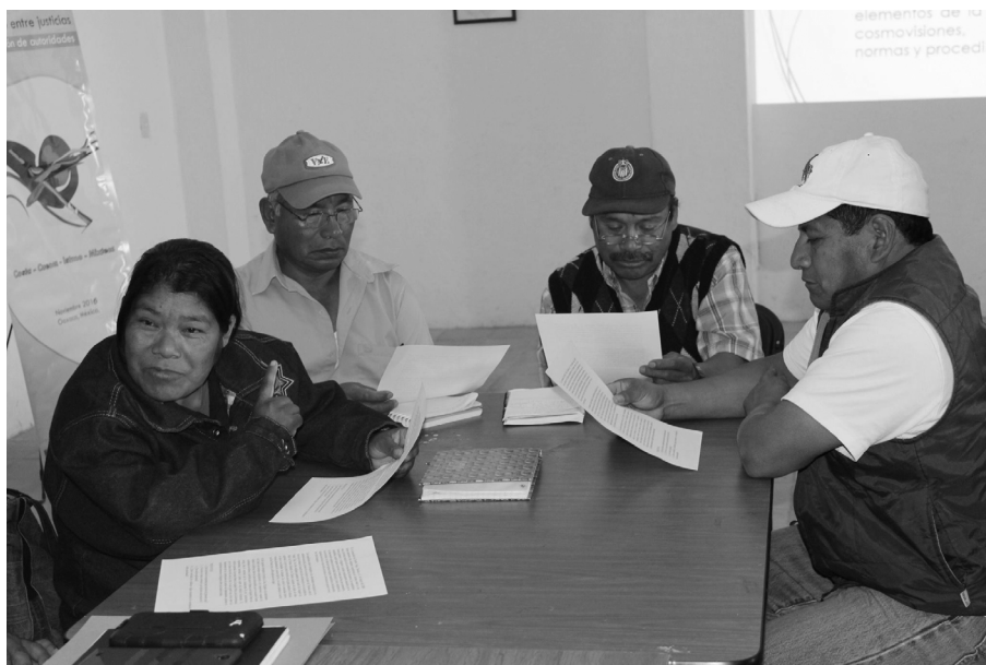
Intercambio de experiencias entre autoridades comunitarias sobre el proceso de impartición de justicia, Tlaxiaco Oaxaca, 2015.

2. El mismo Primer Tribunal Unitario de Oaxaca (expediente 678/2012) declinó competencia a la comunidad de San Miguel Aloapam, Oaxaca, por un asunto conocido como el delito de operaciones con recursos de procedencia ilícita (de acuerdo con el artículo 400 bis, primer párrafo del Código Penal Federal, está sancionado con una pena de 5 a 15 años de prisión y de 1000 a 5 mil días de multa), pero la comunidad dijo no tener competencia ni facultad para juzgar un hecho así porque acontecieron fuera de su territorio.