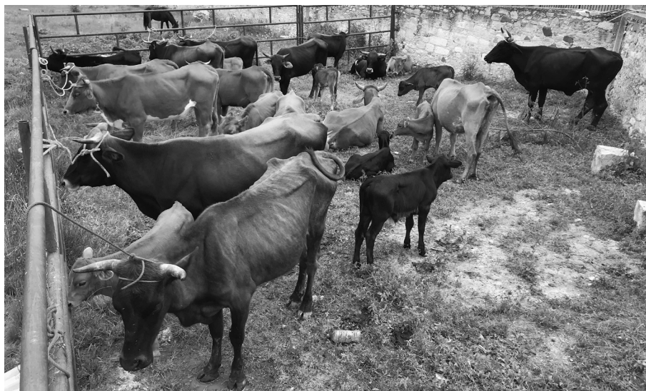
Corral municipal donde resguardan a los animales que causen algún daño. San Cristóbal Suchixtlahuaca, Oaxaca, 2018.

Prácticamente lo mismo ha ocurrido con una persona que se inconformó contra la determinación de la asamblea de excluirlo de continuar cumpliendo con cargos comunitarios y otra persona que solicitó también el servicio de agua potable.