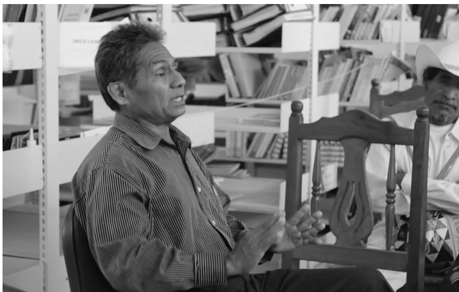
Autoridad de El Huamucho, Santiago Ixtayutla, comparte el mecanismo de resolución de casos, en "Diálogo entre justicias", Santiago Jamiltepec, Oaxaca 2015.

Otra posibilidad para buscar la ejecución de las resoluciones comunitarias es acudiendo ante la Sala de Justicia Indígena (SJI) y Quinta Sala Penal del Tribunal Superior de Justicia de Oaxaca, mediante el Juicio de Derecho Indígena (JDI), para dos cuestiones: