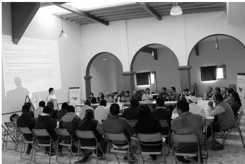
Taller "El Acceso a la justicia pluralista con perspectiva de género" dirigido a autoridades de la región Chocholteca. San Cristóbal Suchixtlahuaca, Oaxaca, 2018.

El ejercicio del derecho a defenderse implica algunas ventajas como la posibilidad de las partes a expresarse en su propia lengua, aportar pruebas sin mayores requisitos, reconocer su responsabilidad en los hechos, conocer inmediatamente el sentido de la resolución de la autoridad comunitaria y poder disculparse para continuar siendo parte de la comunidad.