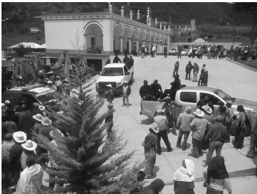
Momento en que habitantes de Santa María Yucunicoco, Juxtlahuaca, Oaxaca, detienen a los policías por extorsión y entrar a la comunidad sin autorización, 2015.

II.- Comunidades indígenas: Aquellos conjuntos de personas que forman una o varias unidades socioeconómicas y culturales en torno a un asentamiento común, que pertenecen a un asentamiento común, que pertenecen a un determinado pueblo indígena de los enumerados en el artículo 2° de este Ordenamiento y que tengan una categoría administrativa inferior a la del municipio, como agencias municipales o agencias de policía. El Estado reconoce a dichas comunidades indígenas el carácter jurídico de personas morales de derecho público, para todos los efectos que se deriven de sus relaciones con los Gobiernos Estatal, y Municipales, así como con terceras personas.