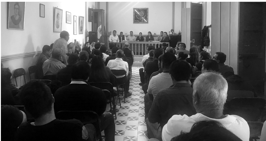
Inicio de funciones de las autoridades de Villa Chilapa de Díaz, Tlacolula, Oaxaca, 2020.

TERCERO. - Por lo precisado en el punto SEGUNDO del Capítulo denominado "I.- NATURALEZA DE LA COMUNIDAD DE SAN MIGUEL SUCHIXTEPEC", tenemos claro que uno de los límites al ejercicio de