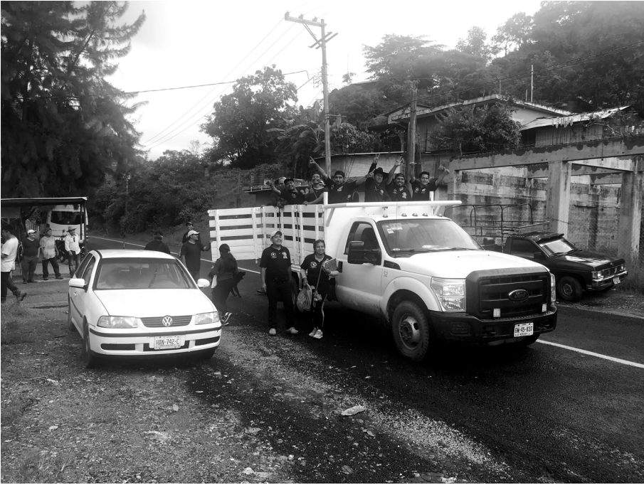
Elementos de seguridad de San Isidro del Estado, Putla, Oaxaca, 2020.