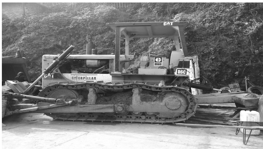
Maquinaria decomisada a personas que pretendían explotar una zona forestal protegida. San Miguel Suchixtepec, Oaxaca, 2015.

El inicio de la respectiva carpeta de investigación (conocida antes como averiguación previa) motivó que el Fiscal de Putla Villa de Guerrero, Oaxaca, citara en dos ocasiones a las personas que tenían el carácter de imputadas.