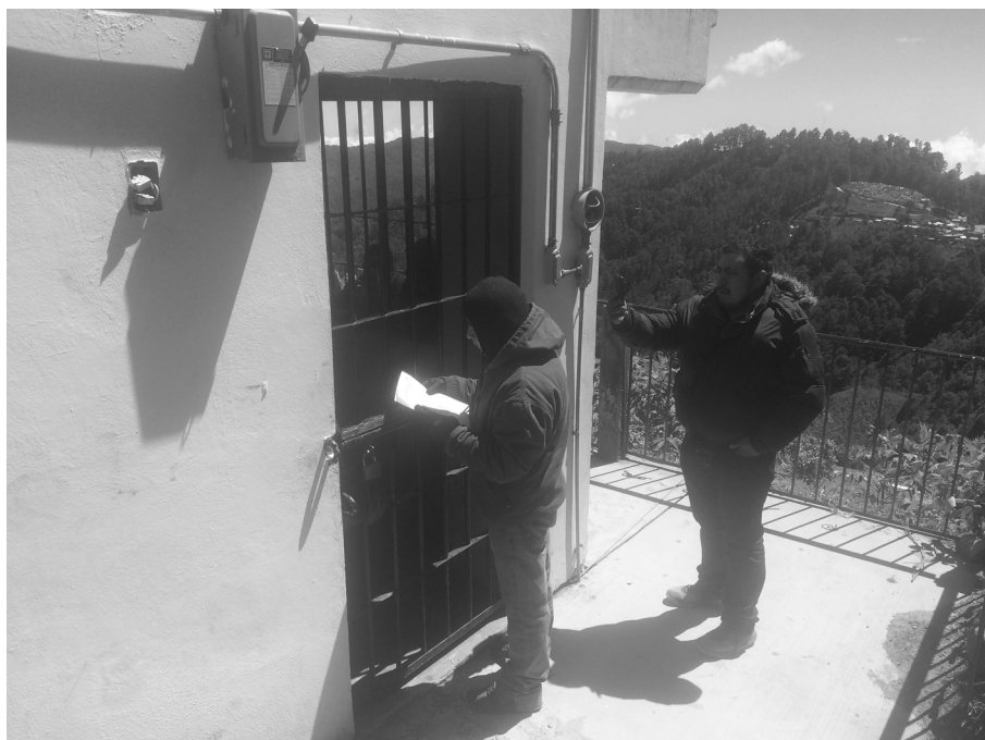
Autoridad le informa a una persona detenida de la determinación de asamblea. San Miguel Suchixtepec, Oaxaca, 2017.

Por ejemplo, en una comunidad triqui de San Juan Copala, Oaxaca, sancionaron a una mujer por no visitar a su suegra, después, un tribunal colegiado de la misma región revocó la decisión y dejó sin efectos la sanción porque el acto no afectaba ningún bien o valor protegido por la comunidad, tampoco lesionaba algún derecho de la suegra. Más bien, la actitud de la nuera con