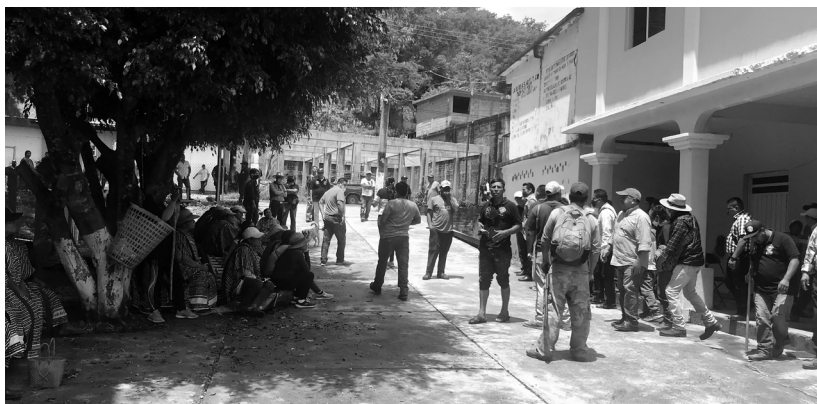
Reunión informativa en San Isidro del Estado, Putla, Oaxaca, 2020.

Ahora bien, de lo anterior surge la duda de cómo deben proceder las autoridades indígenas cuando otra autoridad les declina competencia y les envían la documentación relacionada con el asunto. Lo recomendable es que actúen conforme a las reglas del sistema de justicia comunitario, es decir, como lo harían ante cualquier otro asunto similar; un ejemplo es citar a la persona afectada para que les cuente la forma en que ocurrieron los hechos y de ahí inician con todo el procedimiento de impartición de justicia.