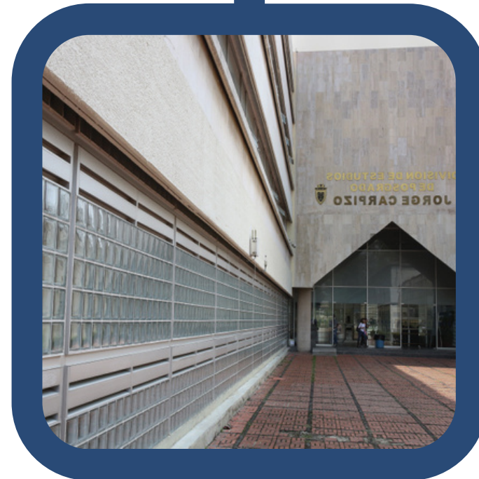
Facultades de Derecho